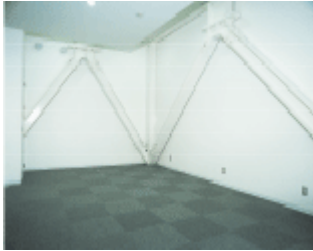
Y型ブレースダンパー