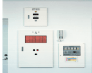
監視・管理パネル