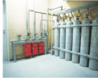
ハロゲン化物消化システム